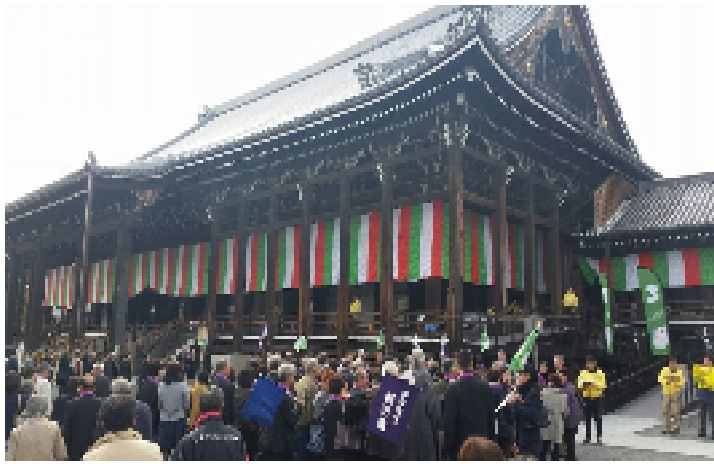
西本願寺の法要に参拝しました。