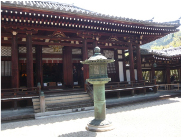
日野の誕生院で皆さんと。